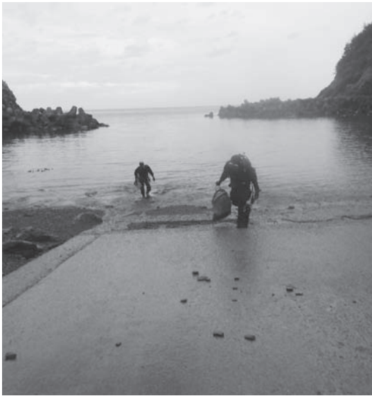
調査中の東京大学教授たち

答 ネダリ浜・弁天漁港については3年間の実施となる。昨年の最終年は、痩せたウニの蓄養を2カ月間行ない、ある程度のキタムラサキウニ蓄養が可能になったことを実証した。実験をした東大の先生からも好評である。