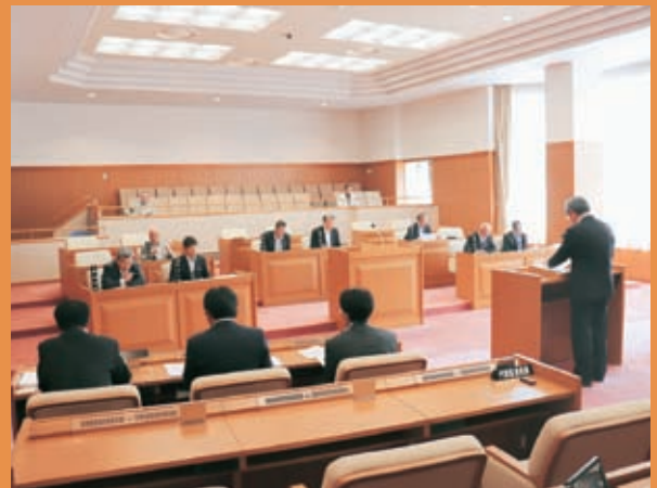
6月定例会の様子です