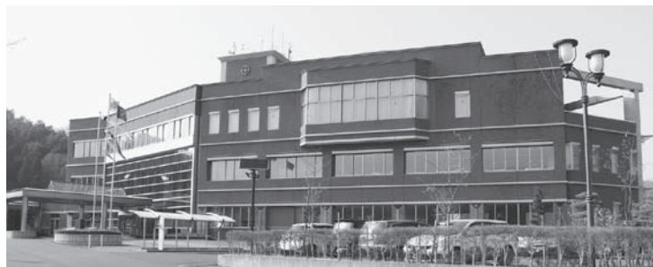
村役場。人口減少が進む中で、村政維持には村民ひとりひとりの意識改革が求められる