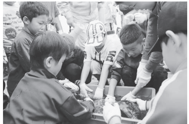
採れた魚に集まる子どもたち