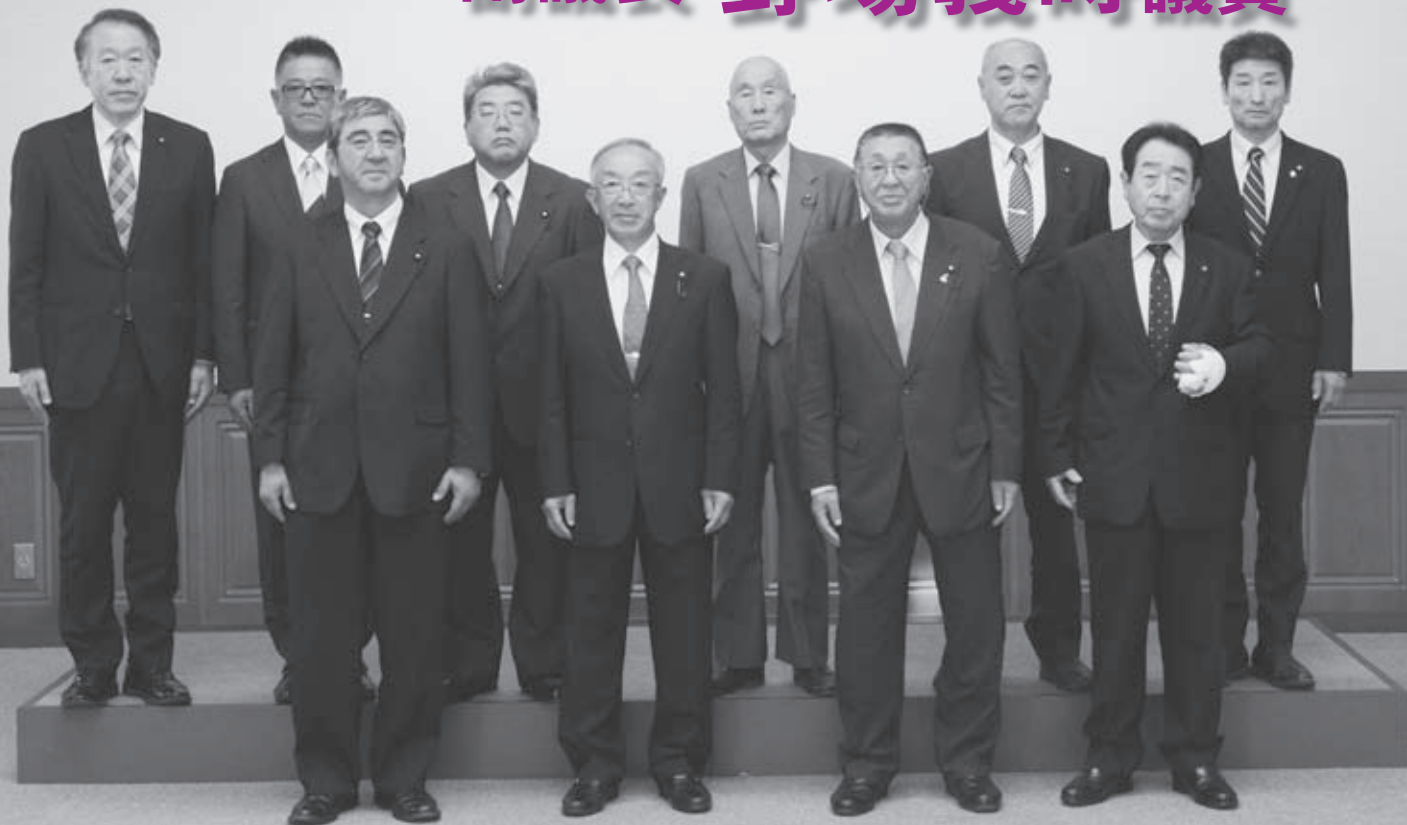
初議会後、10人の新議員で記念撮影