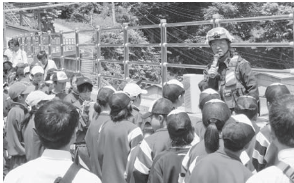
太田名部防波堤で説明を受ける生徒たち

答 昨年同様、一戸小学校と軽米中学校の児童生徒が本村の児童生徒と共に学習するもので、基本的には学校同士で調整しながら行うが、学校と連携しながらできる限りの協力は行っている。