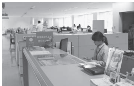
役場1階で働く職員

年2回、岩手医大医師による相談年3回、人事評価面談年2回での全職員への聞き取りで心身の健康への対応の強化を図ったり、ハラメント防止への研修の実施、年次有給休暇の奨励等々にも努めている。